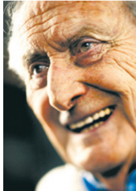
Walter Schultheiß, 82, Schauspieler