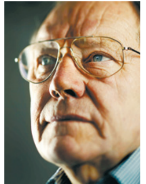
Lothar Weise, 71, Fußballer