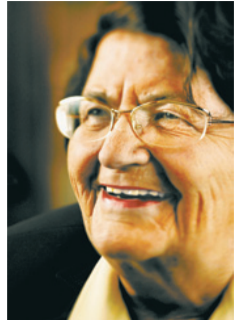
Annemarie Griesinger, 82, Politikerin